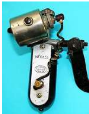
Lucifer / Paris