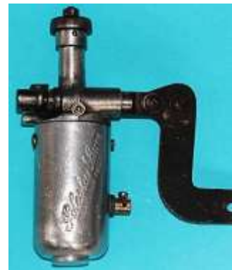
Polestar Lux 12348