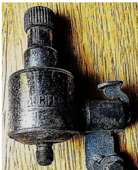
Lucifer 2,4 W