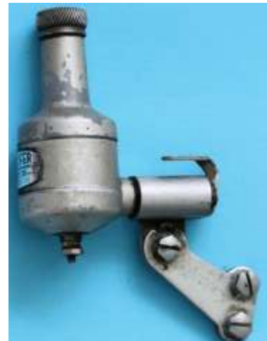
Lucifer Baby. 700 F 305 718