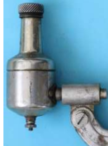
Lucifer Baby 700 B 299 558