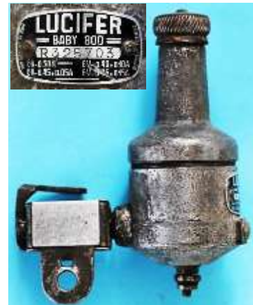
c) Lucifer Baby 800 R 325703