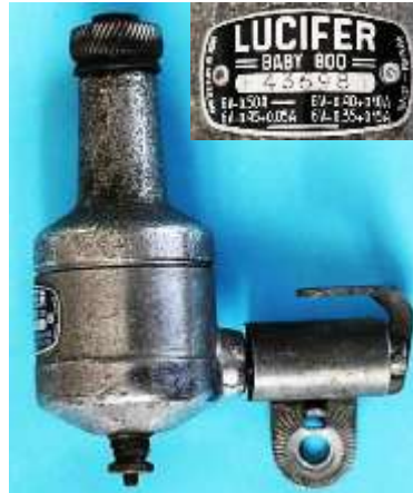
b) Lucifer Baby 800 F 436983