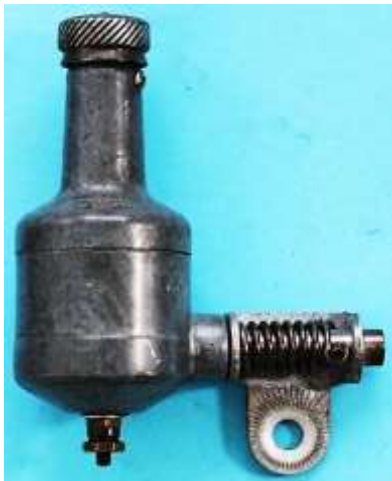
Lucifer Baby 700 B 727039