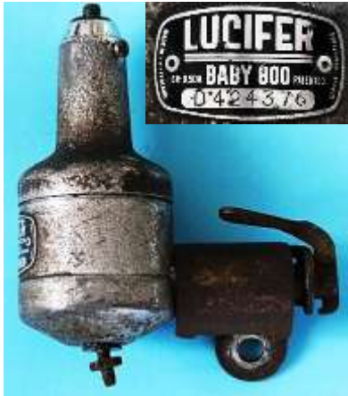
a) Lucifer Baby 800 D 424376