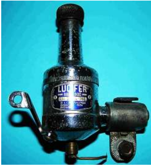
Lucifer Baby 900 M 424471