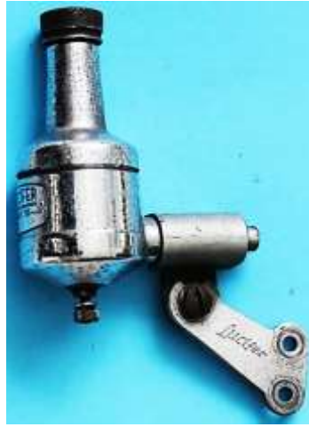
Lucifer Baby 700 C 321 139