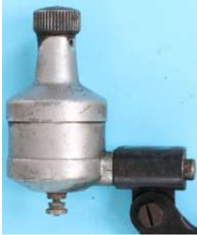
Lucifer Baby 210166