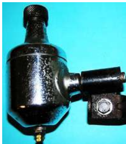
Lucifer Super 12