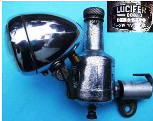
e) Lucifer Baby 800 a R 153449