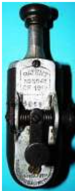
Engl. Must. 6059