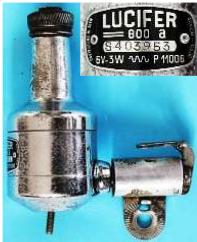
d) Lucifer Baby 800 a S 403953