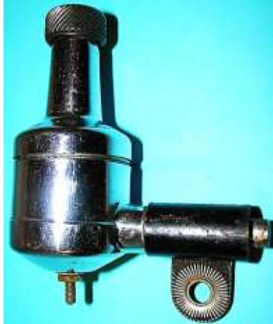
Lucifer Baby 451 553