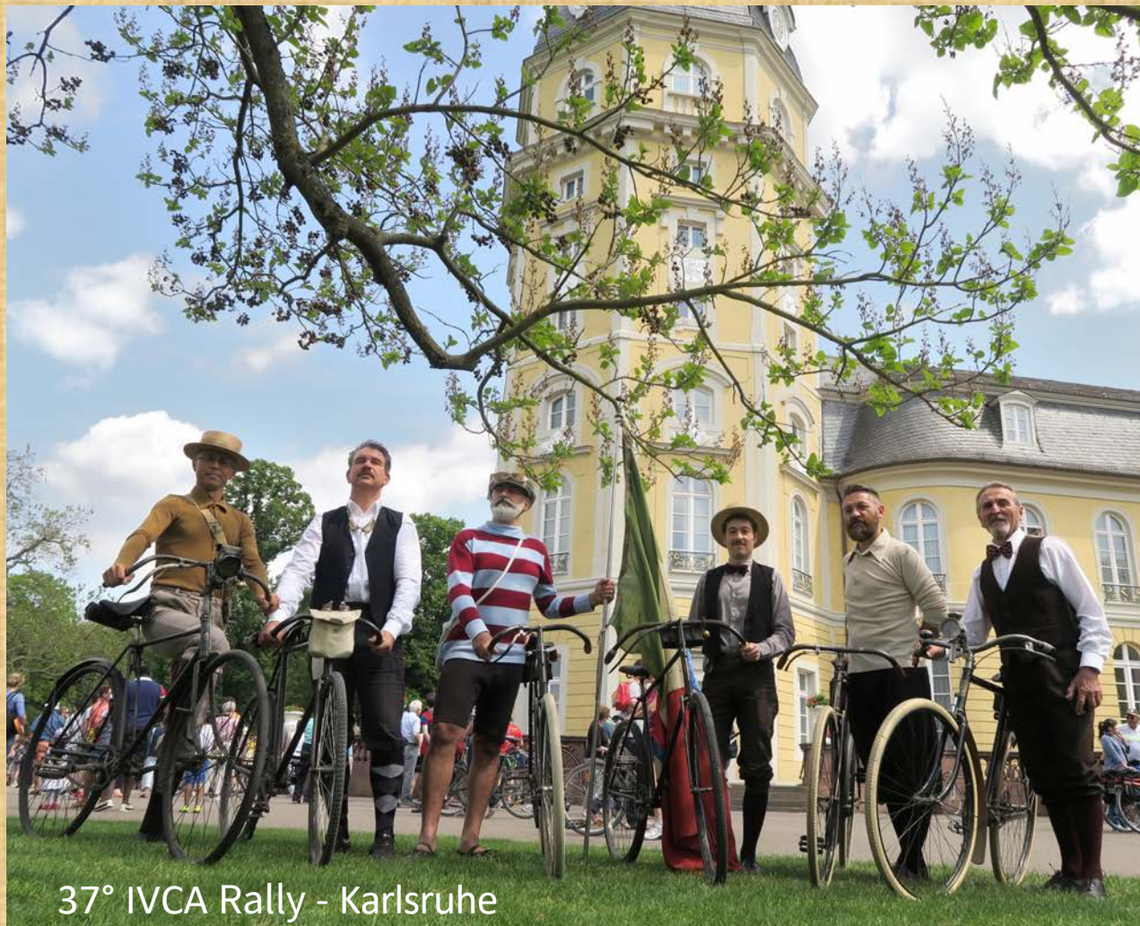
37° IVCA Rally - Karlsruhe