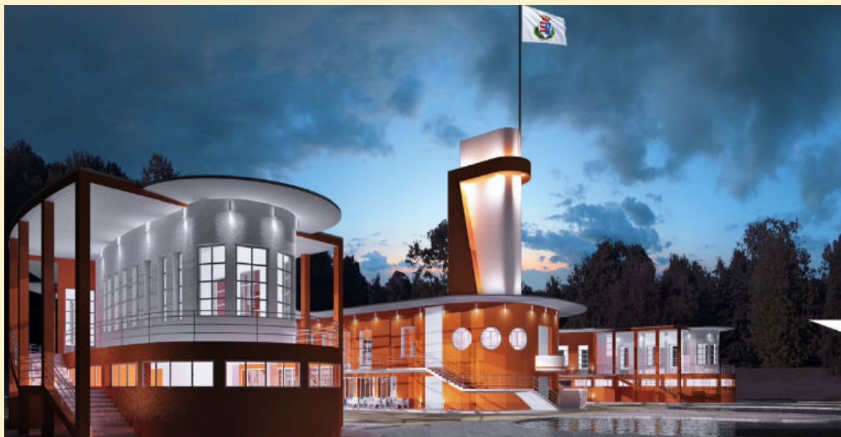
Cremona – Colonie Padane lungo il fiume Po sede del 41° IVCA Rally